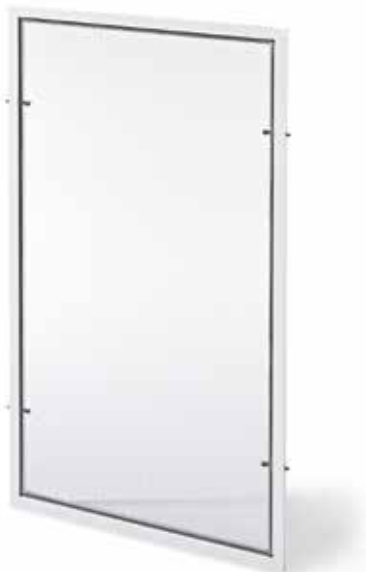
Abb. ähnlich Bild zeigt Spannrahmen F-1