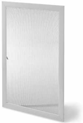
Abb. ähnlich Bild zeigt Spannrahmen E-10